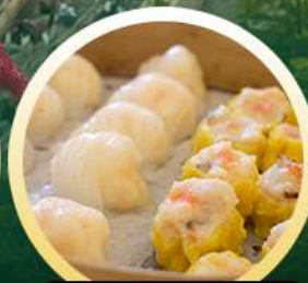
ตี๋มซ่าฮ่องกง