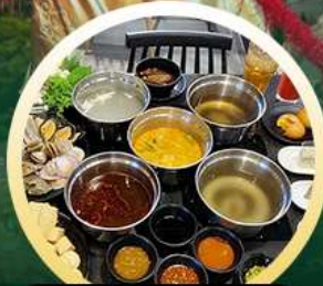
ซาบู่ฮ่องกง

02-04 มี.ย. 18-20 มี.ย. 07-09 มี.ย. 20-22 มี.ย. 13-15 มี.ย. 25-27 มี.ย. 14-16 มี.ย. 28-30 มี.ย.